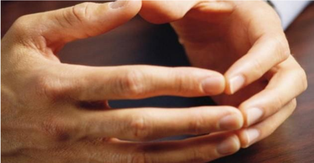
Ilustración 1 Junte los dedos de la mano derecha e izquierda

Junta los dedos de tus manos como se observa en la figura de la ilustración 1